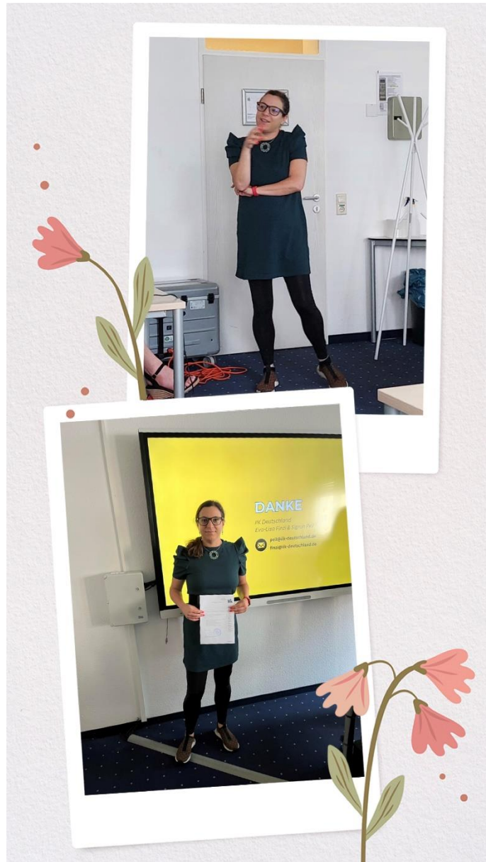
Prezentációs nap és a Zertifikat