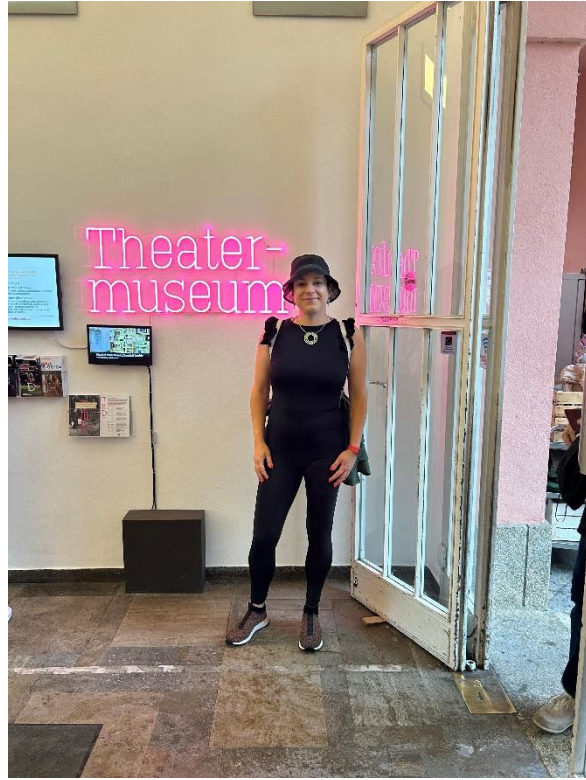
Poetry Slam a Theatermuseumban az IIK szervezésében